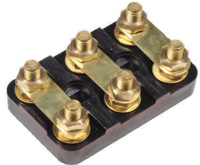
Abmessungen / Dimesnions / Cotes

D'autres formes ou numéros de boulons sont disponibles sur demande.